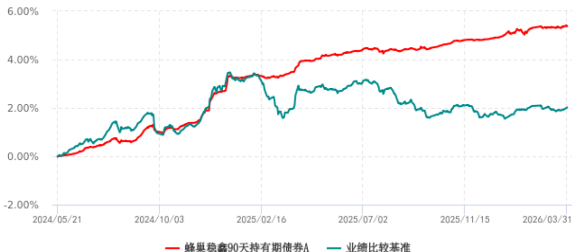
蜂巢稳鑫90天持有期债券A累计净值增长率与业绩比较基准收益率历史走势对比图 (2024年05月21日-2026年03月31日)