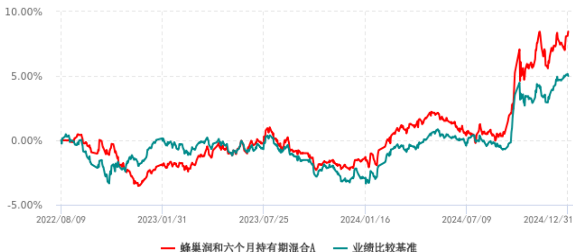
蜂巢润和六个月持有期混合A累计净值增长率与业绩比较基准收益率历史走势对比图 (2022年08月09日-2024年12月31日)