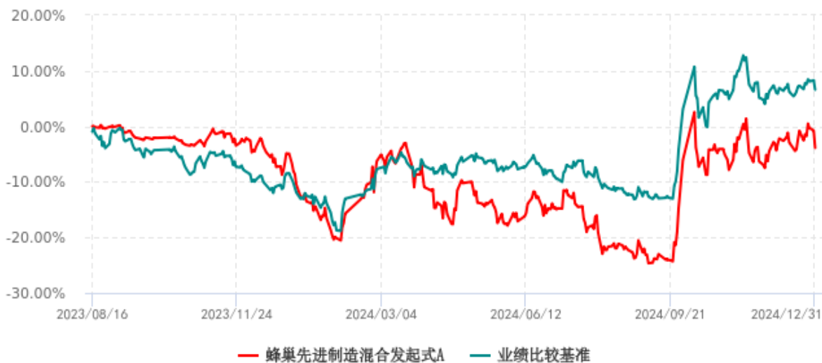
蜂巢先进制造混合发起式A累计净值增长率与业绩比较基准收益率历史走势对比图 (2023年08月16日-2024年12月31日)