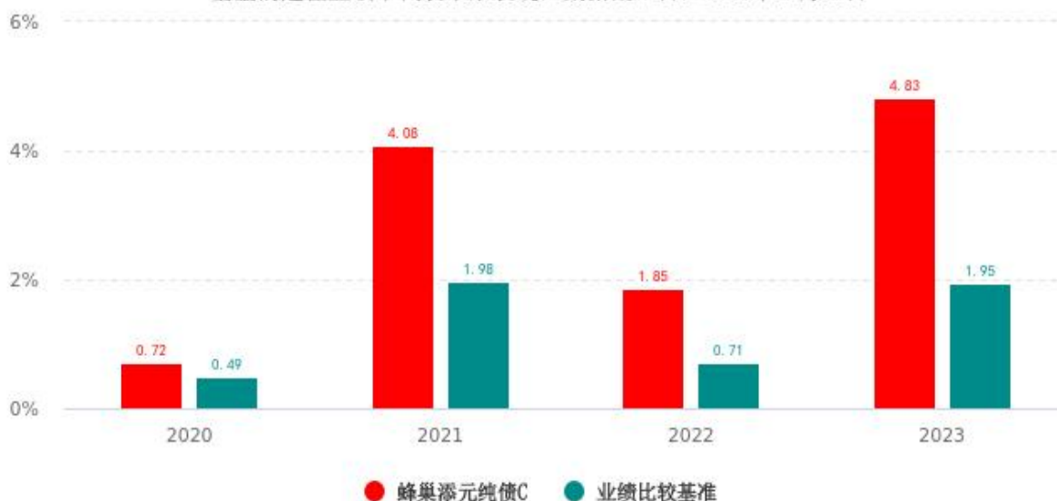
基金的过往业绩不代表未来表现，数据截止日：2023年12月31日